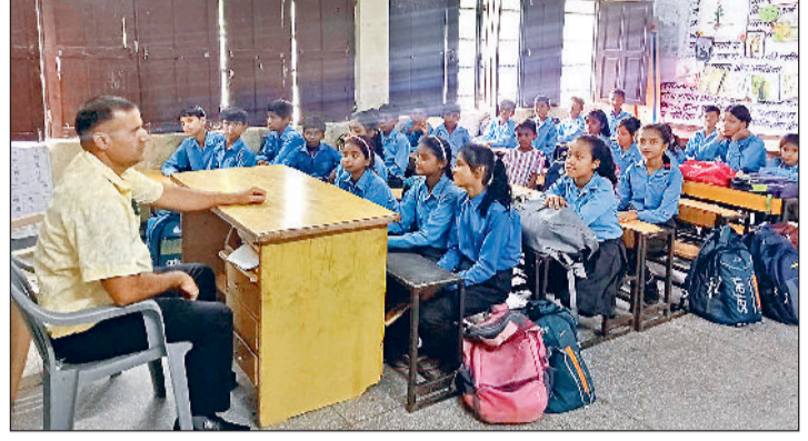
सोनीपत। सेक्टर-15 स्थित राजकीय मॉडल संस्कृति प्राथमिक विद्यालय में शिक्षा ग्रहण करते विद्यार्थी।

जिला मौलिक शिक्षा अधिकारी ने विद्यालय प्रबंधकों को दिए आवश्यक निर्देश, कक्षा तीसरी तक निपुण दक्षताओं और कक्षा 5वीं तक एससीईआरटी की ओर से बनाए गए प्रश्न पत्रों पर आधारित रहेगी परीक्षा।