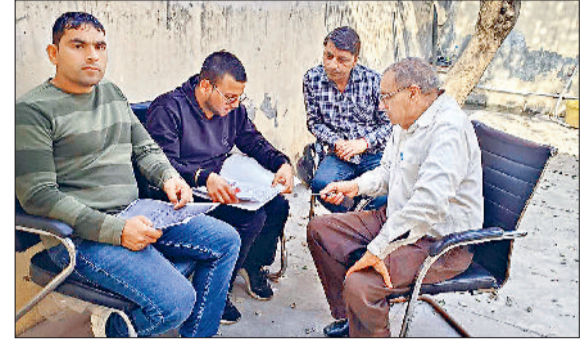
सोनीपत। आईटीआई बूस्टर में शिविर के दौरान नगर निगम कर्मचारियों को दस्तावेज जमा करवाते लोग।