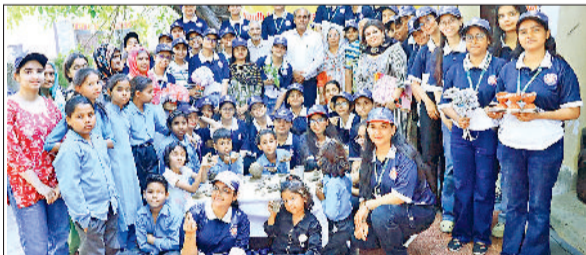
सोनीपत। शिविर के दौरान उपस्थित कॉलेज की छात्राएं साथ में ग्रामीण एवं स्कूल के बच्चे।