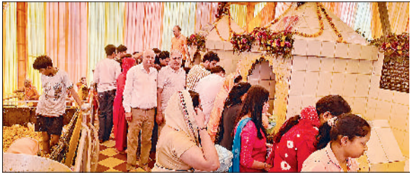
सोनीपत के कामी रोड स्थित रामलीला मैदान में शीतला माता की पूजा-अर्चना कर प्रसाद चढ़ाते श्रद्धालु।

कामी रोड स्थित रामलीला मैदान परिसर में मंगलवार को श्री रामलीला सभा की ओर से शीतला माता का मेला लगाया गया। मेले की शुरुआत शीतला माता की आरती के साथ की गई। मेले में पहुंचे श्रद्धालुओं ने लाइनों में लगकर शीतला माता की पूजा-अर्चना कर मेले में खरीदारी की। श्री रामलीला सभा की ओर से मेले में आए श्रद्धालुओं के लिए विभिन्न व्यवस्थाएं की गईं। शीतला माता का दरबार फूलों से सजाया गया।