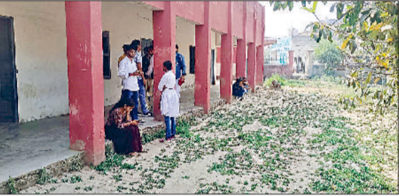
गन्ौर। राजकीय महाविद्यालय में अपनी कक्षा शुरू होने के इंतजार में खड़े बीकॉम के छात्र।

गन्ौर क्षेत्र के विद्यार्थियों के लिए स्थापित राजकीय महाविद्यालय अभी तक अपने स्वयं के भवन से वंचित है। आने वाले शैक्षणिक सत्र में भी कालेज को अस्थायी स्थान से ही संचालित करना पड़ेगा। कालेज भवन के निर्माण को लेकर लंबे समय से चर्चा चल रही है, लेकिन जमीन तय न होने के कारण काम आगे नहीं बढ़ पाया है। महाविद्यालय में पढ़ाई की व्यवस्था भी सीमित