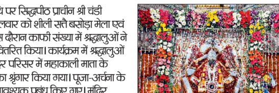
सिद्धपीठ प्राचीन श्री चंडी महाकाली मंदिर में सजाया गया माता रानी का दरबार।