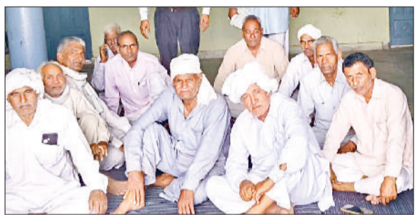
गन्ौर। भारतीय किसान यूनियन (अ) के पदाधिकारी बैठक में भाग लेते हुए।